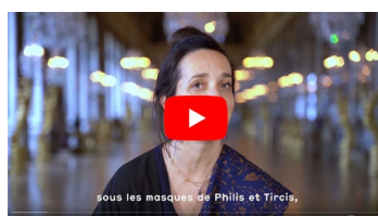
Le thème en 3 questions