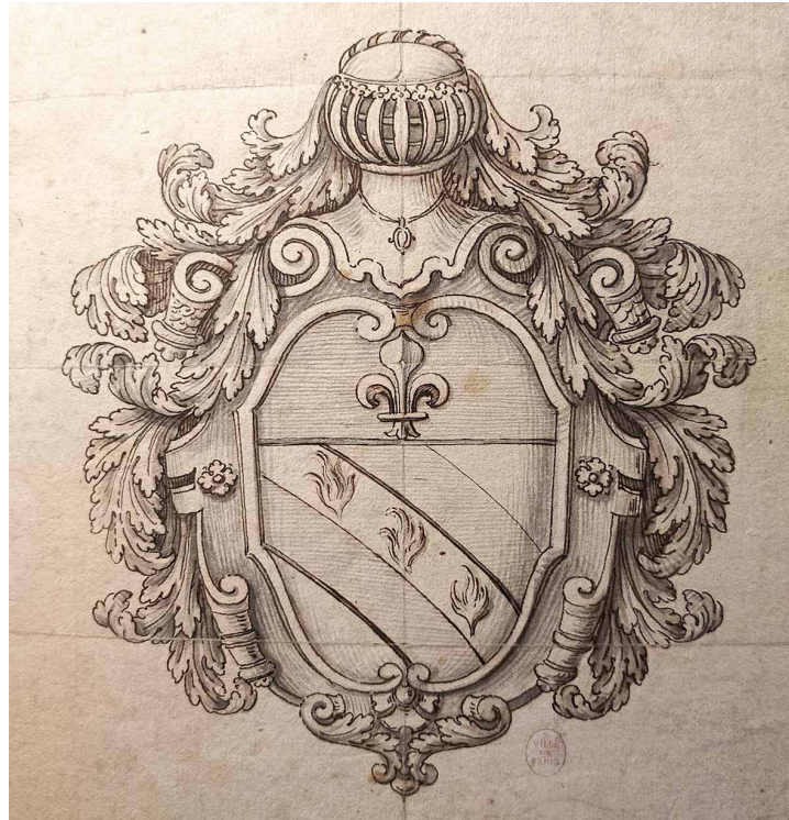
Figure 1 – Blason de la famille Parfait, extrait du Ms. 2283-1 de la Bibliothèque historique de la Ville de Paris. Dessin à la mine de plomb.

fleur de lys d'or 12 – que l'on trouve reproduites dans plusieurs sources du XVIII e siècle 13 , témoignent de cette faveur royale.